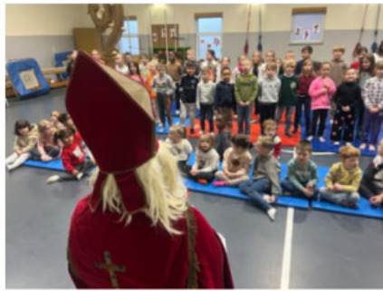
Nous accueillons Saint Nicolas à l'école