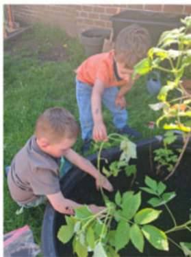
Ecole du dehors