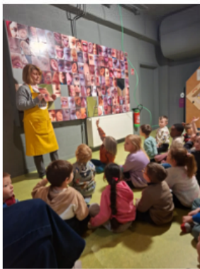
Visite du musée du chocolat