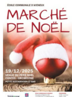
Marché de Noël organisé par toutes les classes de maternelles et primaires