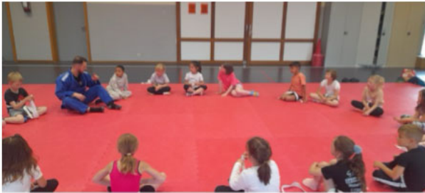
Initiation au « judo » pour les élèves de primaires