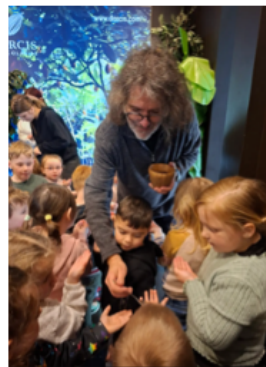
Excursion à Houtopia Univers des 5 sens