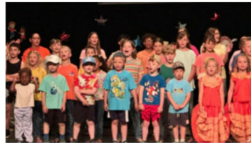
Spectacle réalisé par tous les élèves de maternelles et primaires