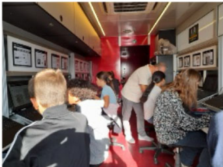
Visite du « camion technique truck » parcours secondaire