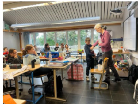
Classe d'eau en p5/P6