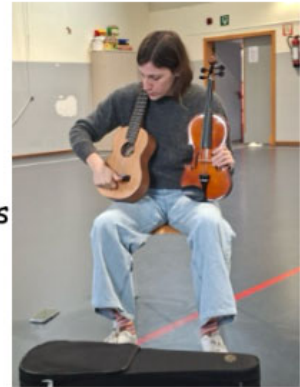
Activités musicales avec les jeunes musicales