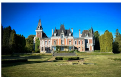
Classes vertes à Esneux (primaires)